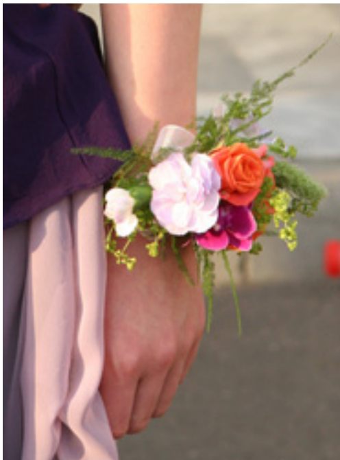
украшение - браслет

15.04.2010 08:26 - Обновлено 18.06.2010 10:58